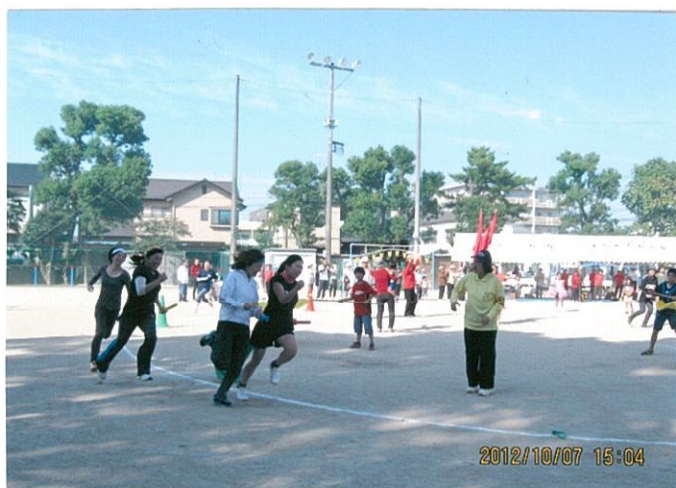
女子町成人内対抗リレー