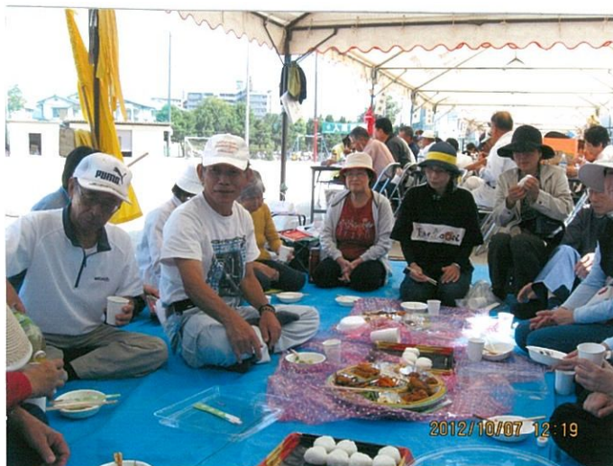
楽しい昼食タイム