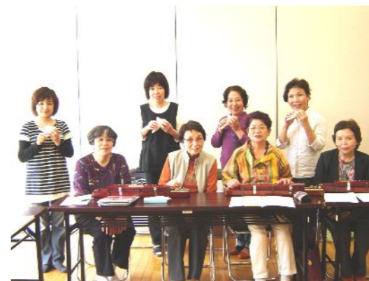
写真は昨年度の活動のものです