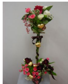
ベビーローズさんの作品 (バレンタインデー)