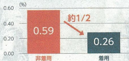
〈グラフ②〉全国での自転車乗用中のヘルメット着用状況別の致死率

これまで子供が着用するものというイメージが大きかったヘルメットですが、これからは 自転車を利用するすべての方で着用が必要 です(努力義務)。ヘルメットを正しく着用することで、交通事故における致死率は大きく下がります。大人も子供もヘルメットを着用して、自転車を安全に利用しましょう。