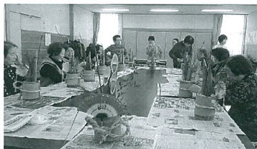
(写真は一昨年のものです。)