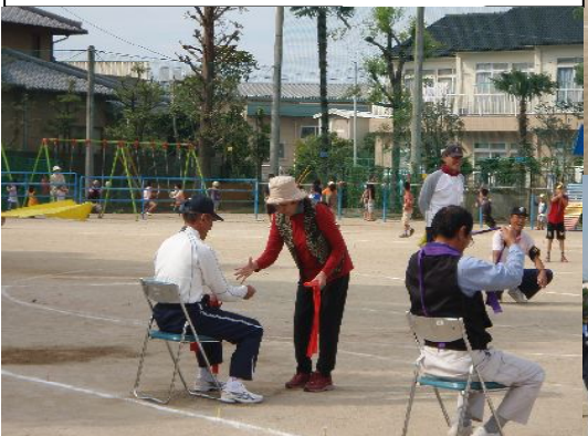
ジャンケンリレー ぐーちょきぱー 1位1町内・2位5町内・3位10町内