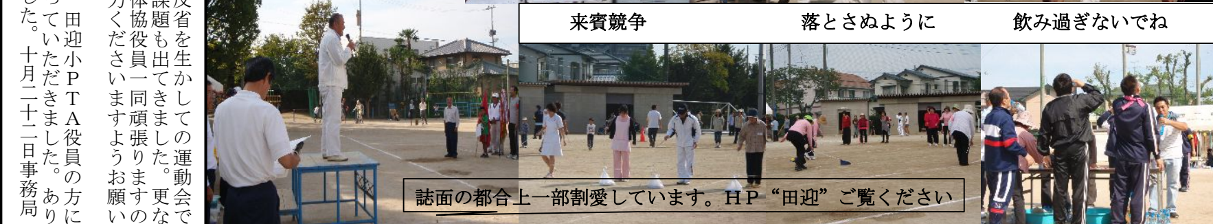
飲み過ぎないでね