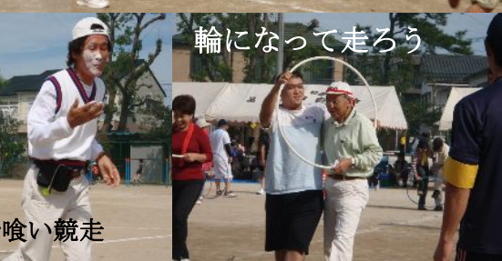
輪になって走ろう