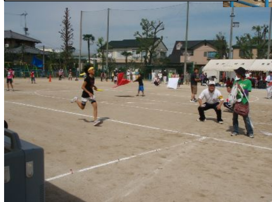
小学生町内対抗リレー