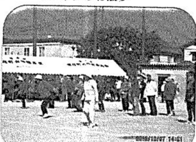
ペンギンのお散歩