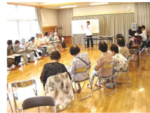
市南保健福祉センター・みゆき園の保健師による生活指導。