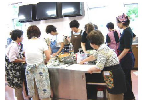
ボランティア、民生児童委員による給食準備。