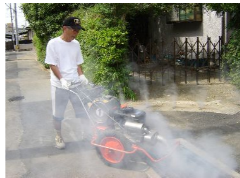
動力噴霧器による薬剤散布