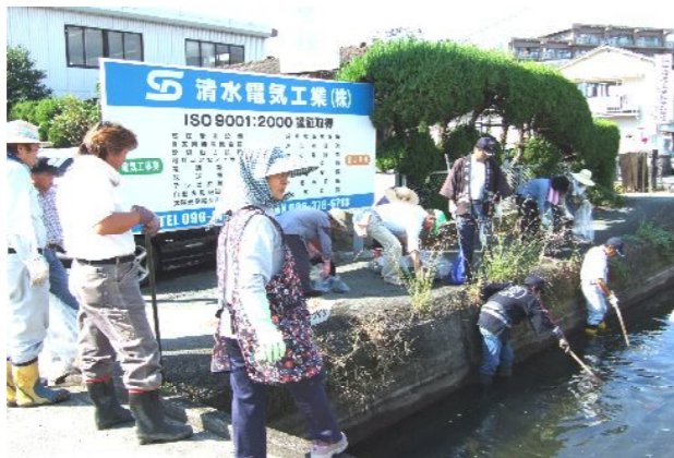
各種団体役員による二の井手用水路清掃作業。