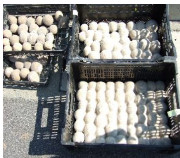
2 週間程度、日陰において発酵した EM だんご。」