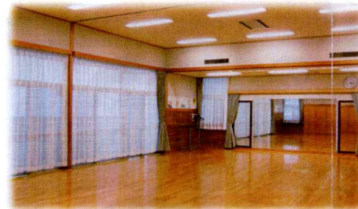
多目的ホール 2分割可 (AB)