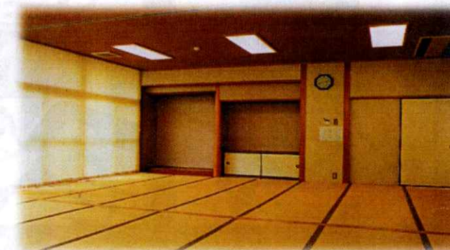
和室 2分割可 (AB)